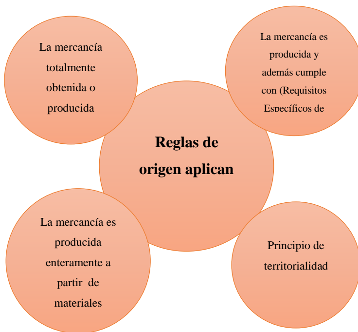
Ilustración 3. Reglas de origen que aplican entre Colombia y la República de Corea.

Elaboración propia a partir del análisis del acuerdo comercial Colombia y la República de Corea