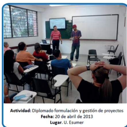
Tabla 2: Contenido del Diplomado en Formulación y Gestión de Proyectos.

El diplomado tiene como objetivo brindar a los líderes y lideresas de la zona noroccidental del Municipio de Medellín herramientas conceptuales y técnicas para la formulación y la gestión de proyectos. Para este se inscriben 40 personas de las tres comunas, y como ya fue mencionado son personas que viene del proceso de formación del Diplomado en Conceptos y Herramientas de la anterior vigencia. El diplomado inició el 26 de enero de 2013 y finalizaron el 4 de mayo de 2013 (Sólo los días sábados de 8:00 am – 1:00 pm) con una duración de 14 sesiones, a continuación se ilustran el nombre de los módulos, fechas y docentes que participaron como facilitadores los cuales se seleccionaron con criterios de formación y de amplia experiencia en procesos de planeación participativa y desarrollo local.