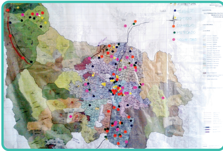
Fotografía: Ejercicio participativo Jornada de Hábitat del Habitar

Dorado – Vivienda Amarillo – Estudio Naranja – Comercio Verde – Mercado Rosado – Sociedad