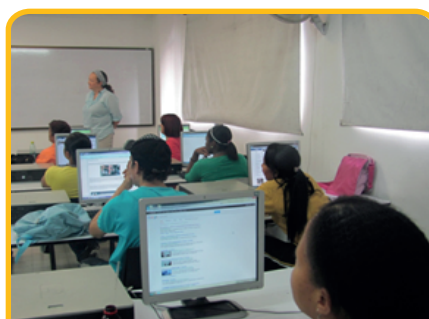
Módulo 1. Conceptos Generales. Grupo 2. Fecha: 26 de febrero Lugar: Esumer.