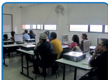
Módulo 1. Conceptos Generales. Grupo 1. Fecha: 28 de enero Lugar: Esumer.