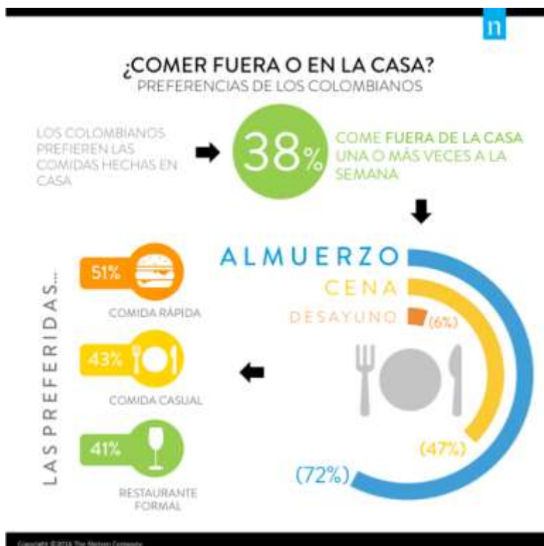
Figura 1. Preferencias de los colombianos a la hora de comer fuera de casa.