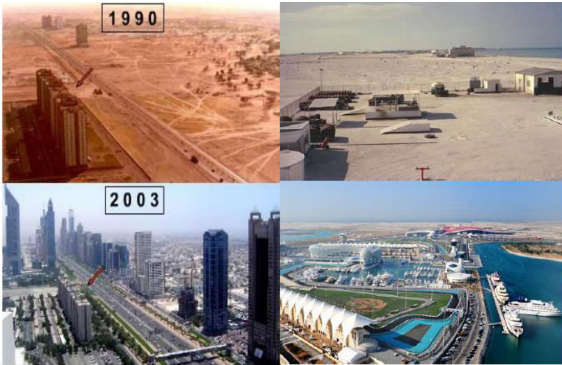
Figura 3. Desarrollo de Dubái y Abu Dhabi desde el año de 1990.