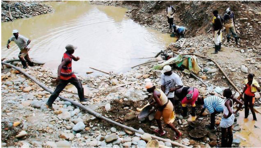
Figura 1. Explotación artesanal (barequeo) de oro en Colombia.