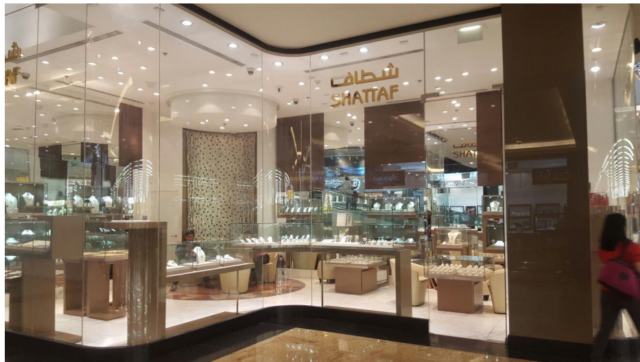
Figura 4. Joyería Sahttaf en Dubai, Emiratos Árabes Unidos.

metales preciosos, desde el año 2004 cuenta con la acreditación del Dubái Multi Commodities Centre , y desde el 2006 con la del Dubái Gold & Commodities Exchange . Otro comprador destacado de oro importado en Dubái es la Compañía “Damas”, quien pone a disposición de sus clientes un 92% de productos con marca propia, ya que esta también es fabricante de joyas, para lo cual cuenta con una planta de manufactura de unos 30.000 m 2 , ubicada en Dubai Multi Commodities Center Authority (Oficina Económica y Comercial de la Embajada de España en Dubai, 2013)