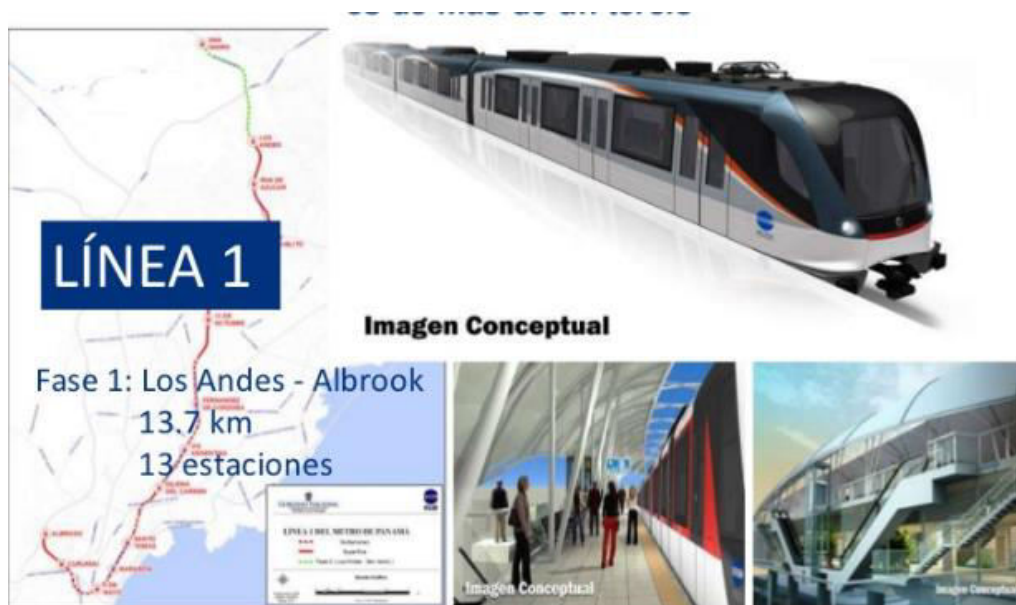
Gráfica .2. Construcción Línea 1