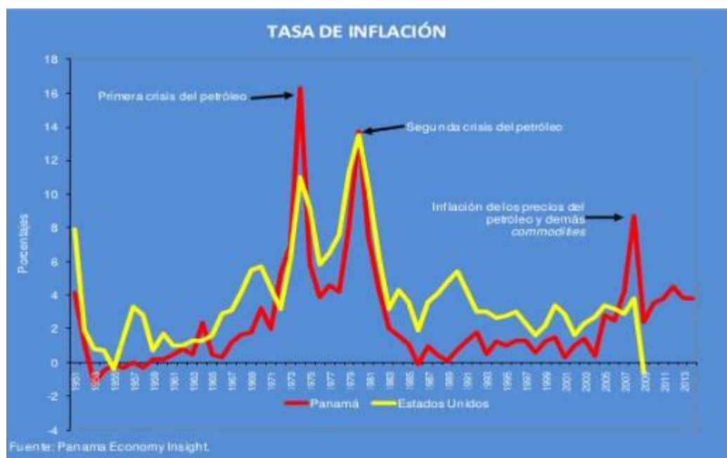
Gráfica .1. Tasa de Inflación de Panamá Vs Estados Unidos.