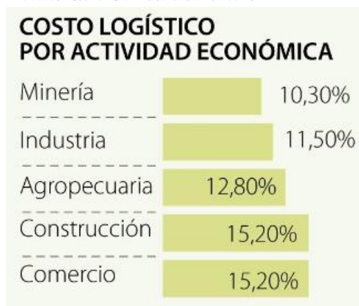
Ilustración 2: Costos logísticos por actividad económica

Como se mencionó con anterioridad, uno de los sectores que mayor cantidad de dinero destina para el pago de servicio de transporte es el sector de la construcción, a continuación, se muestra gráficamente este efecto: