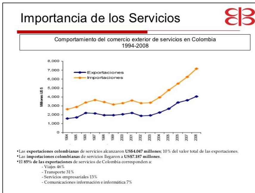
Grafico 2. Importación de servicios 1994 – 2008

En la actualidad el turismo le genera más divisas a Colombia que el total de las exportaciones de productos del sector agropecuario, ganadería, caza y silvicultura, los cuales, en 2011, registraron exportaciones por US$2.264 millones. Y no existe un sólo departamento y municipio de Colombia que no encuentre en el turismo una fuente actual o futura de ingreso. (pág.4)