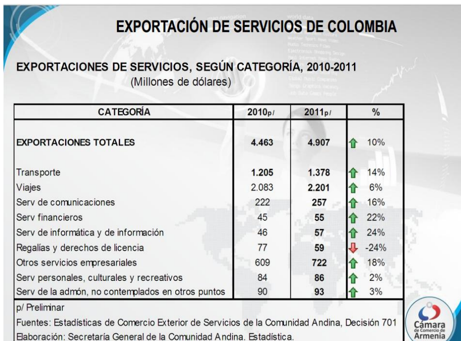
Tabla 1. Exportación de Servicios de Colombia

Se rescata como bastante significativo que en dicho periodo de un total del 85% de las exportaciones de servicios en Colombia, el sector viajes se lleva el nivel más alto con un 46% y el de transportes un 31%, situación que se refleja clara y consecuentemente en la tabla siguiente para periodos futuros.