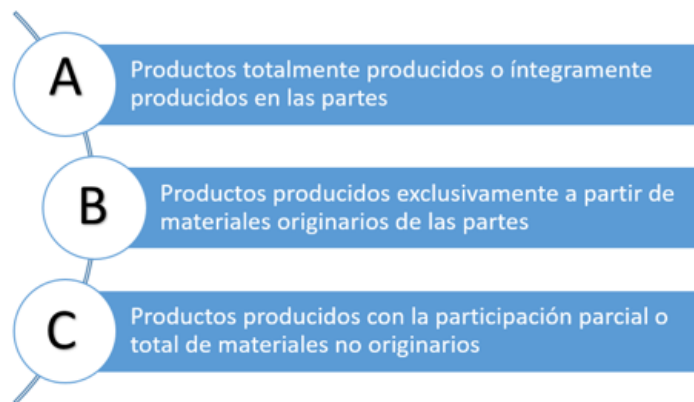
Figura 1. Criterios de calificación de origen