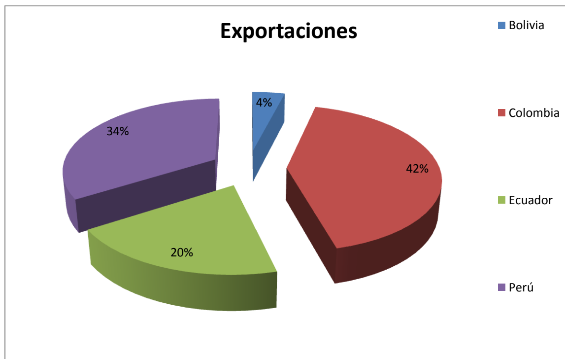
Figura 1: Exportaciones de la CAN hacia APEC 2011 (Estructura Porcentual %)

En el año 2011, Colombia como miembro de la CAN es el principal exportador andino a la APEC, representando el 42 por ciento del total de las exportaciones de la CAN, le siguen Perú, Ecuador y Bolivia con 35, 18 y 5 por ciento respectivamente.