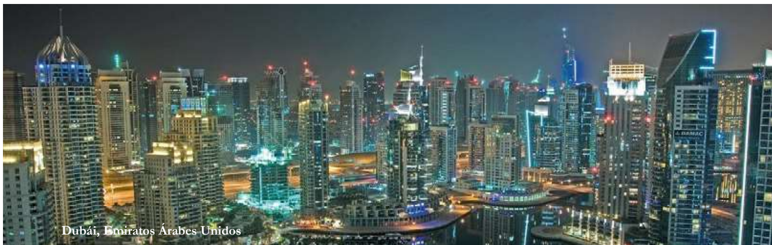
Dubái, Emiratos Árabes Unidos

El proceso como tal de certificación, se divide en ocho etapas que comienzan a partir de que se haga efectiva la presentación como tal de la solicitud, se puede decir que en total respetando los días para cada una de las etapas siguientes: “revisión de las condiciones, aceptación o rechazo, conceptos técnicos, realización de visita de validación, análisis