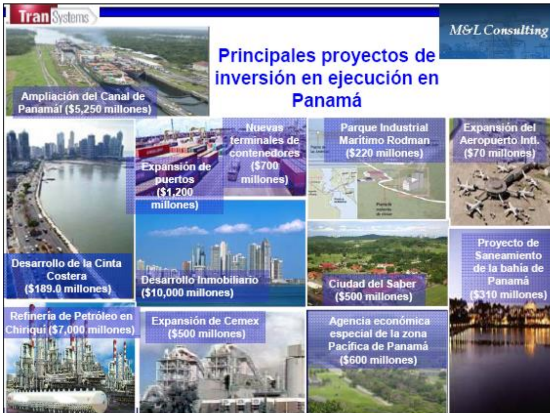
Figura 2. Principales proyectos de inversión en infraestructura de Panamá