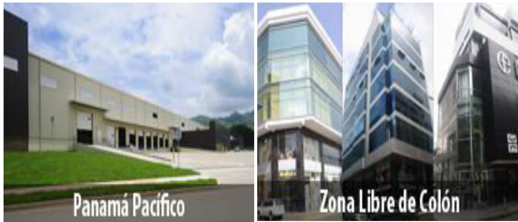
Grafica 3. Panamá Pacífico vs Zona Libre Colón.