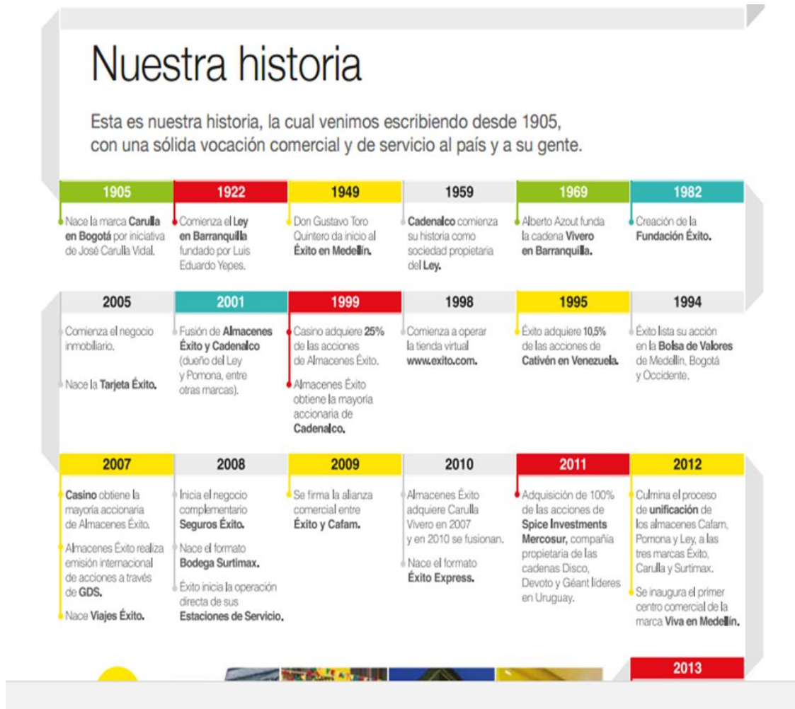
ILUSTRACIÓN 3 RECOPILO DE LA INVESTIGACIÓN DESARROLLO SOSTENIBLE, ALMACENES ÉXITO.

Almacenes Éxito nace en la ciudad de Medellín en un pequeño local del centro de esta ciudad esta marca tiene una gran trayectoria en Colombia y recientemente en otros países de Latinoamérica, su historia se puede ver en la siguiente grafica recopilada del informe y balance de (almacenes Éxito, 2013).