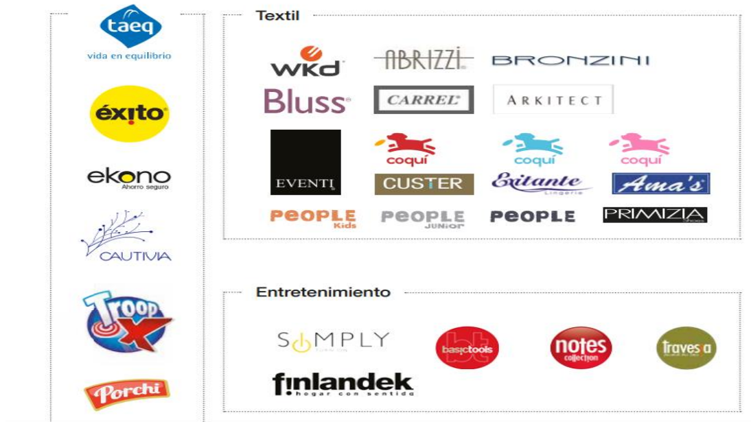
ILUSTRACIÓN 5 RECOPILO DE LA INVESTIGACIÓN DESARROLLO SOSTENIBLE, ALMACENES ÉXITO.

Estas son sus marcas propias, imagen recopilada del informe y balance de almacenes Éxito 2013.