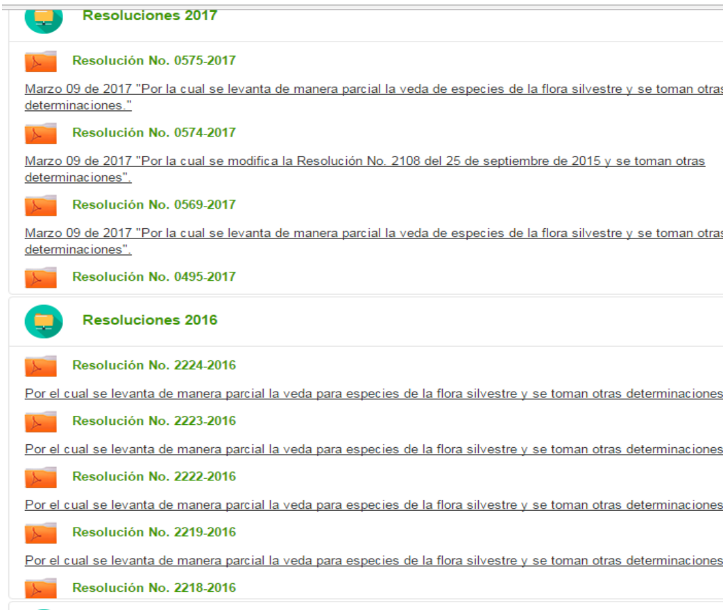
ILUSTRACIÓN 7 MIN AMBIENTE, LEYES Y NORMAS.

Este es el resultado de la búsqueda de soluciones, en ellas están las mejoras y modificaciones que hacen para adaptar las normas al contexto real.