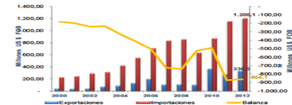
Gráfica 2. Balanza Comercial Colombia – Corea del Sur. Años 2000-2012.

Fuente: Ministerio de Comercio Industria y Turismo (2012)